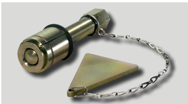
Zum Trennen von Rohrleitungen für DIN, ANSI (ASA) und B. Std. Flansche