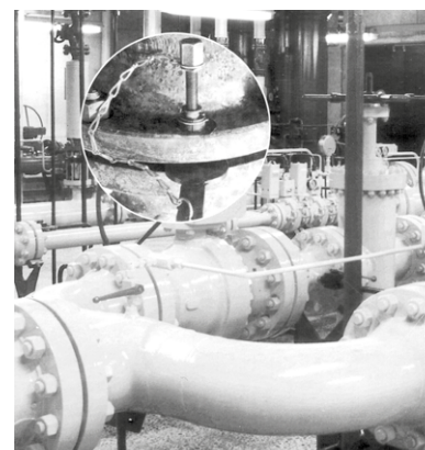
DBP Nr. 2522817 • US Patent No. 4015324